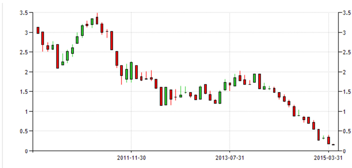
Tassi 10 anni tedeschi

Ormai più che BCE la chiamerei BPE, che sta per Banca Periferica Europea.